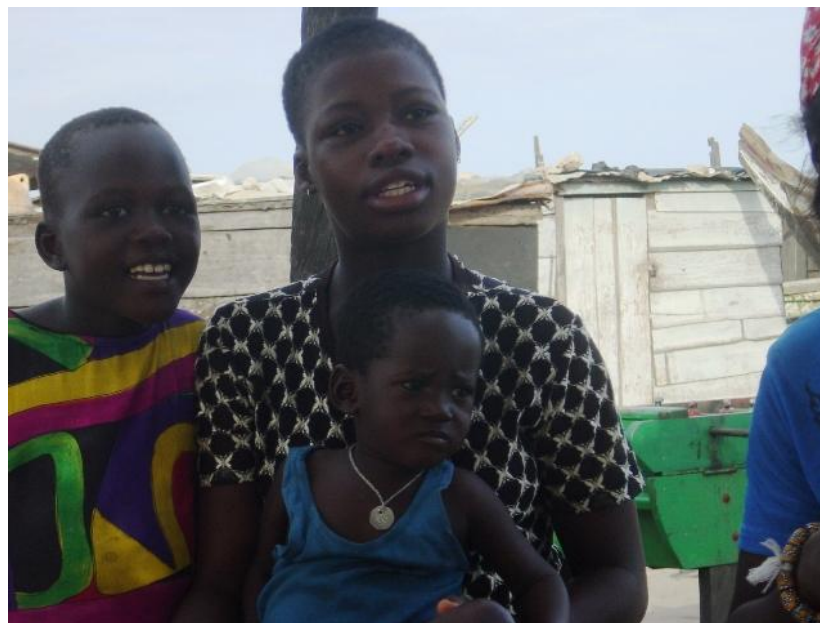
Movilizar a los grupos de interés...